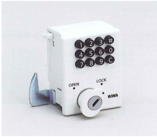
写真： VBL 01