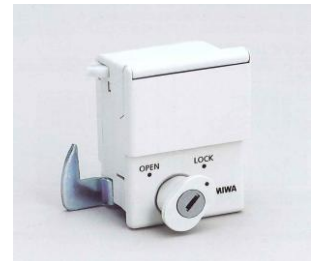
ボタンを隠せるカバー付 VBL02